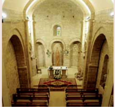
Interior de l'església

L'edifici rebia la llum a partir de tres finestres originals. Al mur nord, la finestra és molt simple, culminada amb arc de mig punt, a l'igual que a l'absis, que incorpora a més una petita arquivolta. A la façana de migdia, la finestra presenta tres arcs de mig punt concèntrics. L'accés primitiu a l'edifici es realitzava per una porta oberta a la façana de migdia, que conserva part de la decoració romànica. Presenta tres arcs de mig punt en degradació. L'arcuació central, de secció quadrangular, amb impostes, descansa sobre uns capitells i unes columnes de factura moderna.