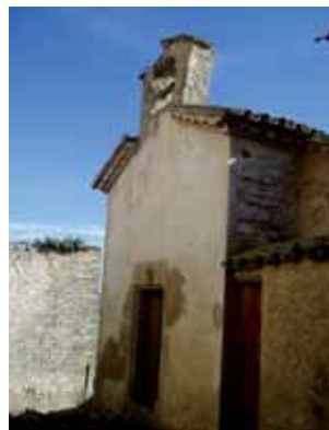
Capella de Santa Llúcia

Cada 13 de desembre, festivitat de Santa Llúcia, se celebra missa en honor a la santa, i la capella roman oberta durant tot el dia per tal de poder visitar-la.