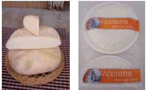
Formatge de cabra i vaca i el clàssic mató

Només els productes curats són els que romandran uns mesos a l'antic celler de la casa perquè assoleixin el punt de maduració òptim.