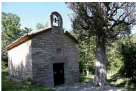
Capella del Molí de la Roda

Tal fou l'abundància d'aigua en aquest indret que, en la capella que hi ha al costat del Molí de la Roda, s'hi venerava primitivament una imatge de la Mare de Déu de les Dolles . Després s'hi venerà la Mare de Déu de la Concepció, fins a l'actualitat, que s'hi venera la Verge de Montserrat. La capella també és coneguda com Mare de Déu dels Molins de Segur o Verge del Mas Scbirà.