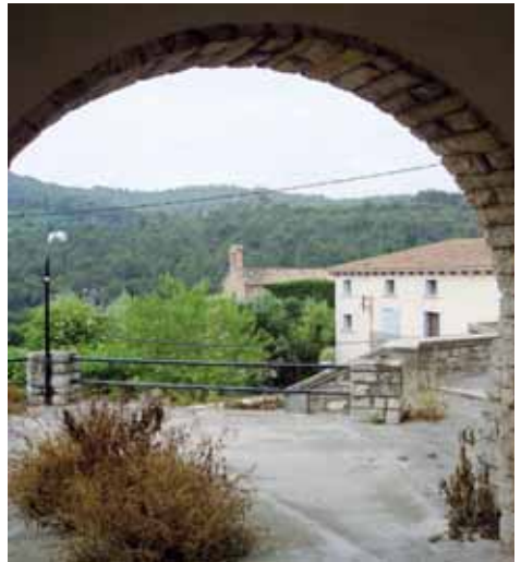
Vista del poble

Durant la seva història, el poble de Santa Maria ha anat alternant l'agricultura amb les activitats d'hostatgeria i els molins fariners, dels quals encara en trobem vestigis.