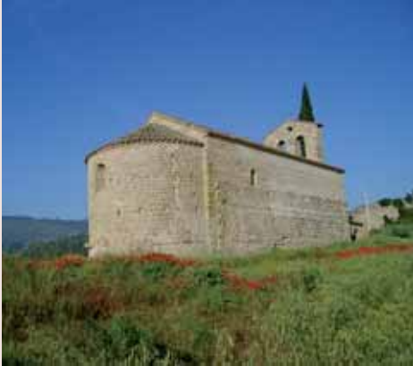
Vista exterior de Santa Maria de Veciana

Fora del nucli de Veciana i a l'altra banda de la riera, hi trobem l'església parroquial de Santa Maria de Veciana .