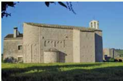
Vista exterior de l'església

Les funcions parroquials d'aquesta església es constaten en una llista de parròquies del bisbat de Vic, entre els anys 1025 i 1050, on figura la del Vim.