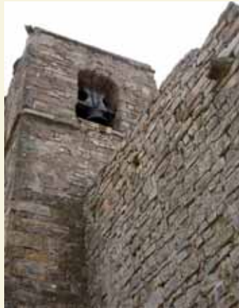
Torre-campanar de l'església de Santa Maria de Segur

A la plaça del poble hi trobem l'església parroquial de Santa Maria de Segur, actualment en desús, i que destaca de la resta de les cases pel seu campanar de planta quadrada. Tot i que els seus orígens se situen al segle XII, fou reedificada posteriorment, i actualment presenta elements del segles XVIII i XIX. A l'interior hi ha dues capelles laterals que presenten uns arcs apuntats molt interessants. Al terra s'hi conserven diverses tombes amb les corresponents làpides de pedra, alguna d'elles del segle XVIII. La porta d'entrada està formada per un arc rebaixat de falses dovelles sostingut per columnes.