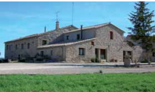
Vista general de Cal Gironella

Cal Gironella és una casa de pagès del segle XVI situada dins el grup de cases anomenat La Clau i que es troba a l'extrem del municipi de Veciana.