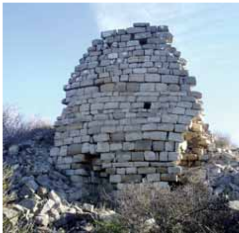
Restes de la torre del castell

Els únics vestigis que resten del castell de Montfalcó són els esfondralls d'una torre de planta circular, de la qual gairebé només es conserva un fragment de mur arquejat d'uns 4 metres d'alçada i un gruix d'uns 3,1 metres.