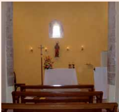
Absis interior de l'església

En general, l'edifici de Sant Pere de Montfalcó el Gros respon a una obra romànica aixecada en el transcurs del segle XII i inserida dins l'àmbit rural.