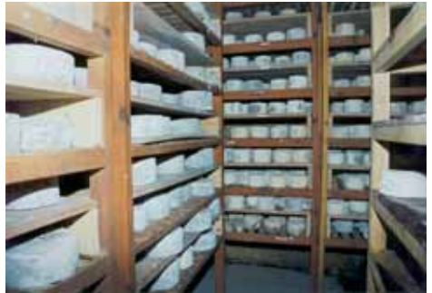
Celler on maduren els formatges

Per a l'elaboració de tots aquests productes se segueix un procés totalment artesanal i natural que comença amb la muniada de les cabres de la pròpia explotació. Una vegada s'ha obtingut la llet, es duen a terme les tasques pròpies d'elaboració a l'obrador, on es deixen reposar les peces fins que arriba el moment de comercialitzar-les.