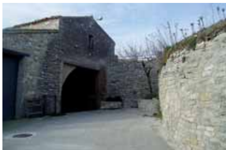
Un dels bells raconets que conserva Montfalcó el Gros

El nucli, a part de les ruïnes del castell, està format per tres cases pairals, així com les seves corresponents dependències destinades a usos agrícoles i ramaders.