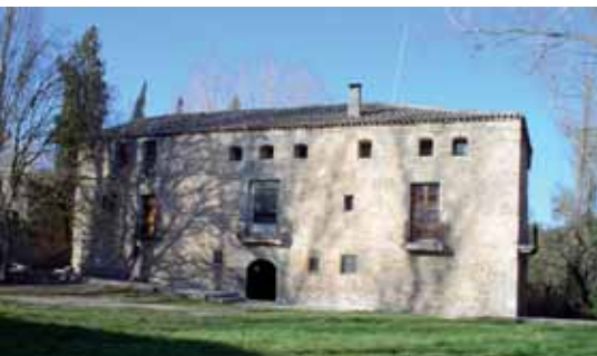
Vista de la façana principal del casal

El Molí de la Roda és un casal conegut històricament com a Molins de Segur, i està situat en un fondal frondós on neix la riera Gran, principal afluent del riu Anoia.