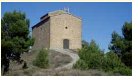
Vista exterior del santuari

Al turó de davant del nucli de Segur hi trobem el santuari de la Mare de Déu del Puig del Ram, patrona del poble.