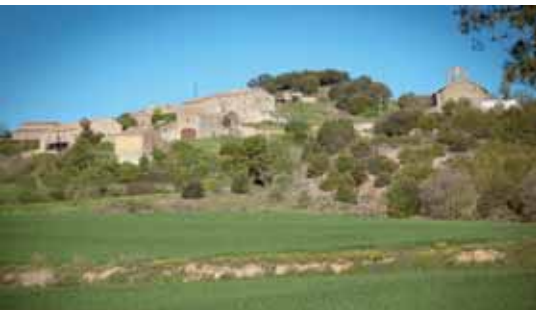
Vista de Montfalcó el Grós amb la capella de Sant Pere en primer terme

El nucli de Montfalcó el Gros va néixer a redós del seu castell, del qual ja se'n tenen notícies cap als anys 1027 i 1031, quan en diversos documents en Guillem Guifré de Balsareny diu que posseeix el castell per herència paterna.