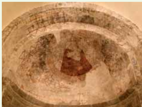
Pintures murals de l'absis

A la volta interior de quart d'esfera de l'absis, s'hi conserven unes pintures murals de gran valor històric.