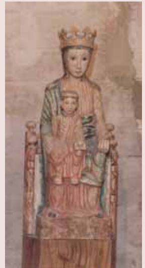
Imatge de la Mare de Déu de Veciana

Per les seves característiques, proporcions, expressió i estil es creu que la imatge és del segle XIII. La curiositat que presenta aquesta marededéu és que el Nen seu sobre la cama dreta, al contrari de la majoria de verges, on el Nen seu sobre la cama esquerra o al centre de la falda.