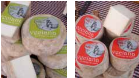
Dos dels tipus de formatge de cabra que s'elaboren

Els productes que s'hi fabriquen van des de mató fins a iogurt, passant per tot tipus de formatges. D'aquest darrer producte, se n'elabora una àmplia gamma, que es classifica segons el seu procés d'elaboració. Amb llet pasteuritzada de cabra s'elaboren formatges semicurats, semicurats amb romaní i formatges de pasta tova. Amb llet crua de cabra es fan formatges curats de dos i sis mesos de maduració i formatges blaus. A més, s'elaboren formatges tendres, tant de cabra com de vaca, entre d'altres.