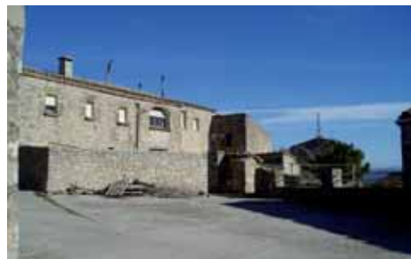
Les masies que formen el nucli destaquen per la seva antiguitat

Des de Montfalcó, situat a 771 metres d'altitud, es té una magnífica vista panoràmica de tot l'altiplà calafi i la serralada de Montserrat.