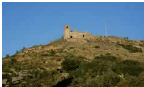
Església de Sant Salvador de Miralles

L'església parroquial de Sant Salvador de Miralles , que fou bastida al segle XII i reedificada el 1767, va ser saquejada i cremada el 1936 durant la guerra civil espanyola, i des d'aleshores roman abandonada.