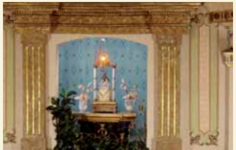
Cambril amb la Mare de Déu

Interiorment és un edifici d'una sola nau, amb un cambril per a la imatge de la Verge, una talla que sosté un ram a la mà dreta, amb el Nen a la falda, el qual beneeix amb la mà dreta i sosté la bola del món amb l'esquerra. Aquesta talla és de les poques imatges tardogòtiques de la comarca de l'Anoia.