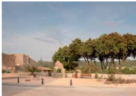
Plaça de Mn. Esteve Prat

D'entre el grup d'edificacions que formen el petit nucli de Sant Pere, cal destacar-ne la casa de cal Muntaner, adossada a l'església de Sant Pere, i amb una història fortament lligada a la de la mateixa edificació religiosa.