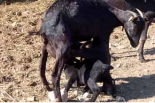
Ramat de cabres propi

A la part més alta del nucli de Segur hi trobem la casa de cal Jaume Gran, on des de l'any 1997 hi ha un taller artesanal on s'hi fabriquen els productes sota la denominació de Formatges Veciana .