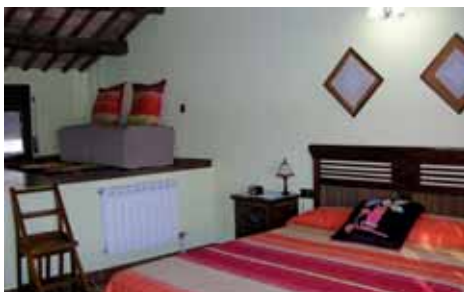
Habitació de La Premsa