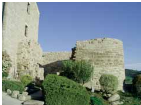
Ruïnes de la capella de Sant Miquel del castell de Veciana

Del castell no en queda res, tret de les ruïnes de la capella de Sant Miquel, a tocar de l'antiga casa consistorial. Aquesta capella, del segle XII, era una construcció d'una única nau capçada a llevant per un absis semicircular orientat a sol ixent. Encara es constata la presència d'una finestra a l'absis, adovellada i culminada amb arc de mig punt.