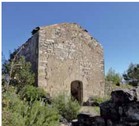
Capella de Sant Gabriel

A prop del nucli de Veciana, hi trobem la capella de Sant Gabriel, patró del poble. Es tracta d'un edifici rectangular, sense absis ni cap ornamentació especial. La seva façana és severíssima i, llevat del portal de volta de mig punt un xic aplanada, no tenia cap finestra ni obertura.