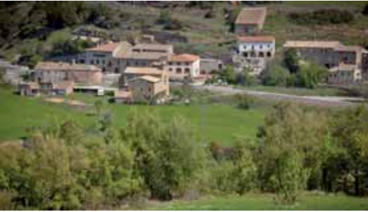
Vista del poble amb l'església romànica en primer terme

El nucli de Santa Maria del Camí , tot i pertànyer al municipi de Veciana, està separat d'aquest per una franja del terme municipal de Copons. I és que Santa Maria fou independent fins l'any 1840, quan fou annexat al municipi de Veciana.