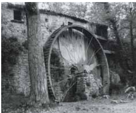
Roda hidràulica que donà nom al Molí

És un gran edifici bastit al segle XVII i reformat al segle XVIII amb finestres d'arc conopial i altres de tipus renaixentista. La part antiga, amb espielleres i volta, forma com una torre i és coneguda popularment com la presó, ja que era, en efecte, la presó de la baronia. Sota el casal hi havia els molins senyorials moguts per una gran roda hidràulica mecànica, desapareguda l'any 1981, que donà el nom popular de Molí de la Roda.