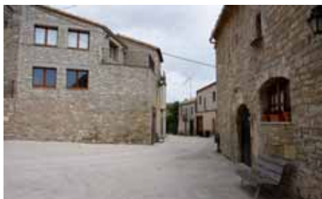
Plaça del poble

El castell fou enderrocat el 1616 per ordre del duc d'Alburquerque i virrei de Catalunya. Es creia que el castell havia esdevingut un cau de bandolers que actuaven per la comarca, amb la passivitat de Miquel de Calders, que es considerava sospitós per la seva amistat amb el bandoler Perot de Rocaguinarda.