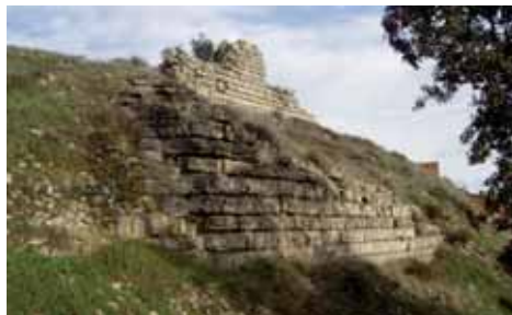
Restes de l'antiga muralla del castell de Segur

Pel seu aparell, el castell de Segur sembla una obra del segle XII.