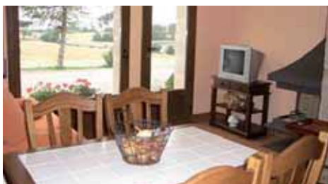
Menjador i llar de foc d'El Cup