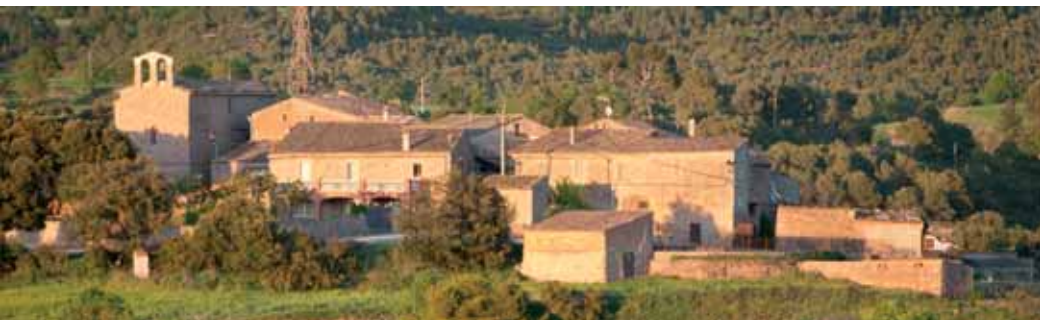
Vista general de Sant Pere del Vim

El nucli de Sant Pere del Vim , format per unes poques cases i l'església de Sant Pere, es troba a tocar de la carretera C-1412, entre les poblacions de Copons i Els Prats de Rei.