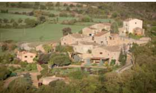
Vista del nucli de Veciana

El poble de Veciana nasqué a redós del seu castell, documentat l'any 1045, quan Bernat Guifré féu testament, en el qual deixava l'església en primera instància a la seva muller i, a la mort d'aquesta, a la canònica de Sant Pere de Vic.