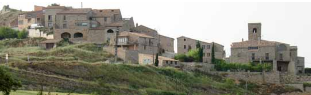
Vista del nucli de Segur

Aturonat a 780 metres d'altitud trobem el nucli de Segur, que va néixer a redós del seu castell.