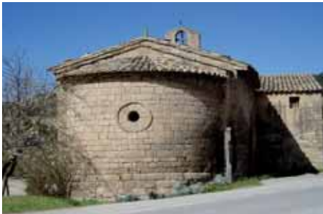
Església romànica de Santa Maria del Camí

La història de Santa Maria del Camí ha estat sempre lligada amb la del camí ral que li ha donat origen i vida. Així, veiem com l'església més antiga que trobem al nucli fou inicialment capella o hospital, situat a peu de l'antic camí ral d'Aragó, i priorat benedictí des de 1228, moment en què fou cedit a Santa Cecília de Montserrat, que hi va posar monjos i va fer aixecar l'actual església, de característiques encara romàniques.