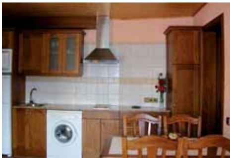
Cuina-menjador d'El Cup

La situació aturonada de cal Gironella i envoltada de camps de conreu i boscos fa que, des dels allotjaments, es tinguin unes magnífiques vistes. Si a aquestes panoràmiques privilegiades de l'Alta Anoia s'hi sumen el silenci i la tranquil·litat que envolten la finca, es pot dir que cal Gironella és un excel·lent lloc on desconnectar dels quefers diaris i connectar-se amb la vida.