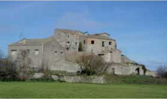
Vista del nucli de La Rubiola

El nucli de La Rubiola fou una quadra independent que s'annexà al municipi de Veciana l'any 1840.