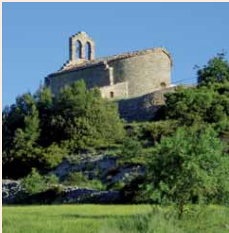
Exterior de l'església

L'església es trobava dins el terme del castell de Montfalcó el Gros. Tot i que, cap al segle XI, tenia condició de parròquia, ja que apareix citada al llistat de parròquies del bisbat de Vic datat entre els anys 1025 i 1050, cap al segle XIII o inicis del XIV va perdre aquesta condició per passar a ser una sufragània de Santa Maria de Veciana, tal i com continua sent en l'actualitat. Arquitectònicament és un edifici d'una única nau, culminada per un absis semicircular a llevant. Aquesta església ha patit un important seguit de remodelacions al llarg de la història que han canviat notablement la seva factura romànica. Entre les modificacions més importants destaca el sobrealçat general de l'edifici, més evident a l'absis, que va igualar l'alçada dels dos cossos de l'edifici.