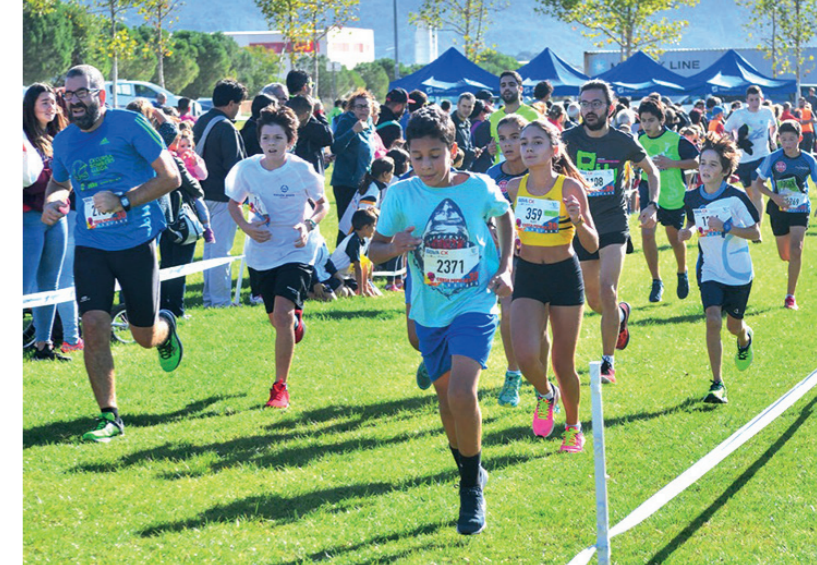
Imatge de la 39a edició de la Cursa Popular 2017 d'Igualada, s'han estrenat recorreguts i epicentre d'activitat, al voltant del Parc Central.